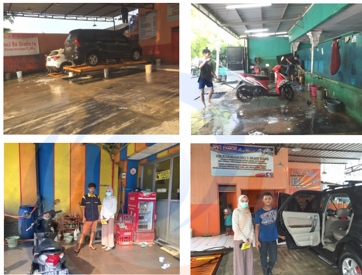
Gambar 1.1 FOTO SURVEY

Landasan teori dimanfaatkan sebagai pemandu agar fokus penelitian sesuai dengan fakta di lapangan. Selain itu landasan teori juga bermanfaat untuk memberikan gambaran umum tentang latar penelitian dan sebagai bahan pembahasan hasil penelitian.